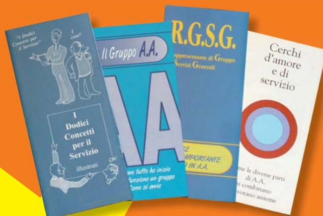
Kit Cerchi d'Amore e di Servizio € 6