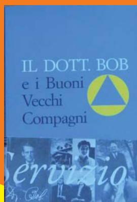
"Il Dott. BOB e i Buoni Vecchi Compagni" € 11